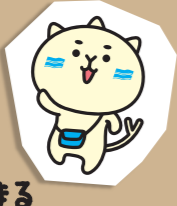
よどがわさん よどまる