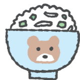
(東淀川区 まーちゃんママさん)