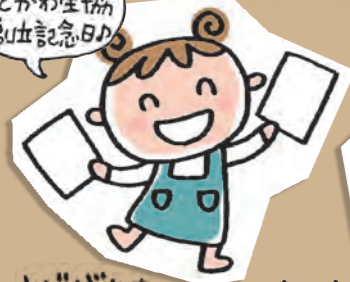
よどがわさん よどまる