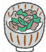
(高槻市 タモンズさん)

豚こま肉をサラダ油で炒めて、その後ザク切りにした小松菜を入れて炒める。水と鶏ガラスープの素・塩コショウと醤油と少しの砂糖を入れ味を調える。水溶き片栗粉でとろみを付け、ごま油で香り付け。ご飯にかけて丼に。