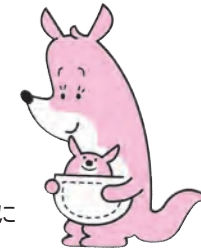
託児スタッフ(有償)「かんがるー」