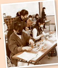
「コープのひろば」 のようす